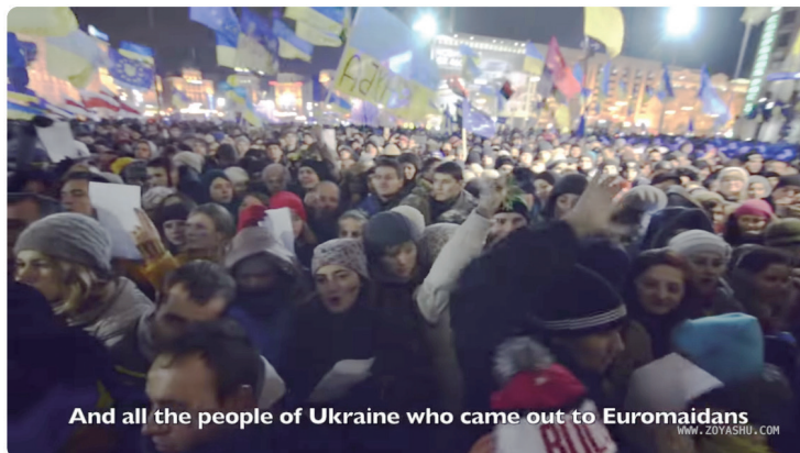
Euromaidan: thousands of Ukrainians sing the Ode of Joy / Zoya Shu Video - YouTube