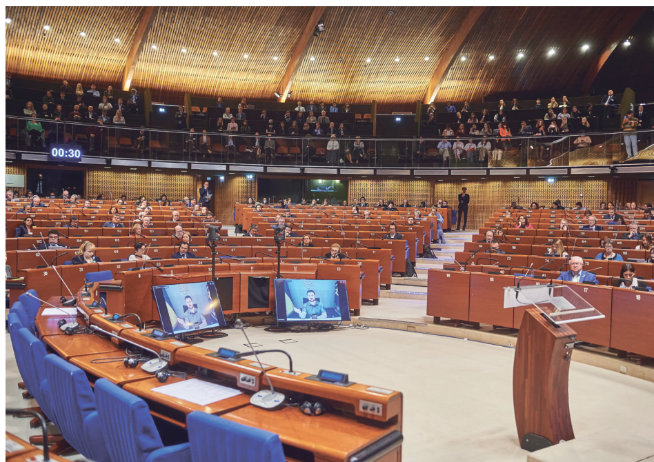
Europarådet den 13. oktober 2022 præsident Zelenskij taler til PACE

Men er dette et problem? Hvis Rusland fortsat deltager i åbne konventioner, så må hensigten vel være at overholde dem sammen med andre medlemsstater? Ideelt set ja. Konventioner er jf. traktatretten mellem stater og Europarådets rolle mere tekniske. Men russisk deltagelse er under den nuværende europapolitiske krise hverken troværdig eller hensigtsmæssig. Den vanskeliggør eller umuliggør et givet samarbejde eller dets udvikling. Ganske meningsløst er, at evt. russiske repræsentanter modtager refusion for omkostninger til møder i rele-