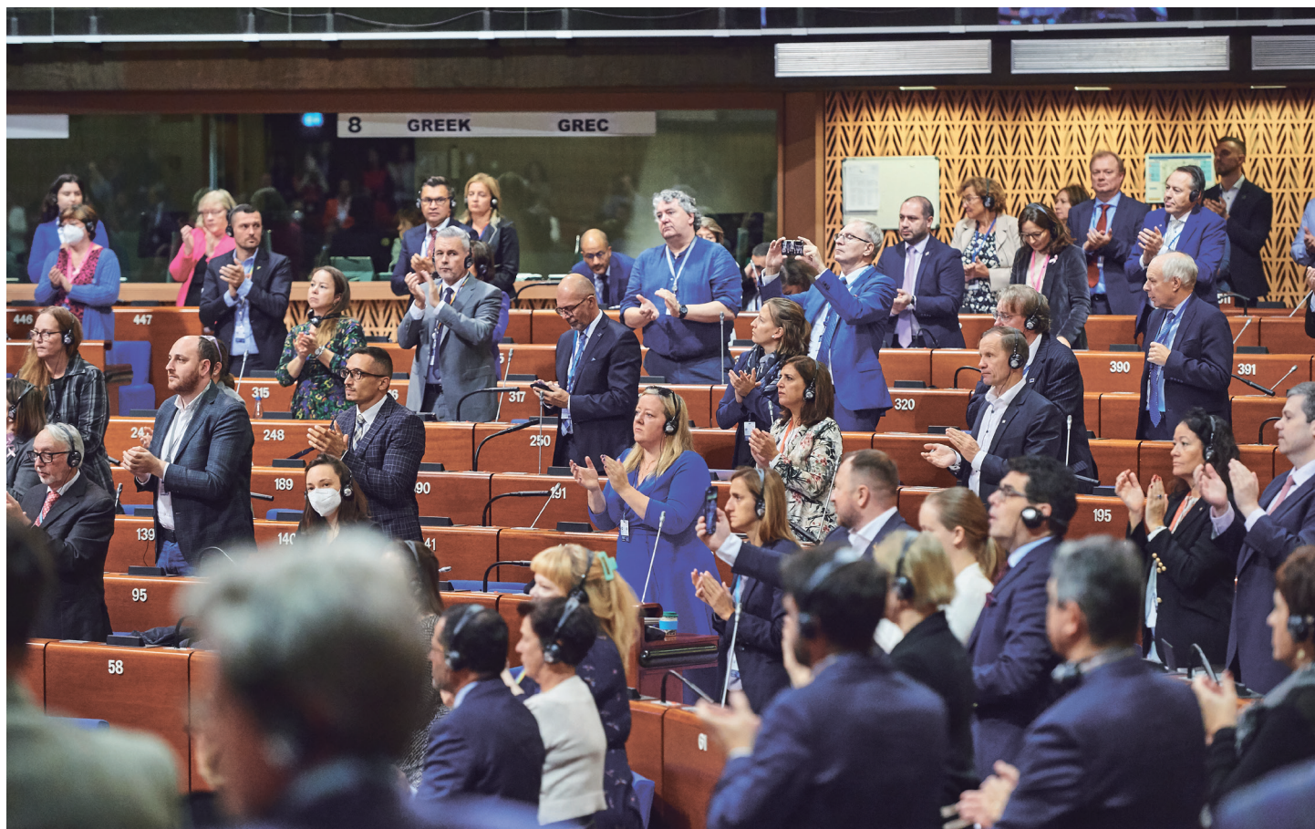
PACE den 13. oktober 2022 parlamentarikerne applauderer

medlemsstat - at lade sig repræsentere i nogen form for arbejde under og i organisationen. En suspension ville ikke have berørt Ruslands øvrige rettigheder eller pligter under nogen Europarådskonvention, men den Kierkegaardske fejhed greb sekretariatet i dets rådgivning, Ministerkomiteen fulgte trop og valgte denne udgang. Det russiske udenrigsministerium må more sig kosteligt.