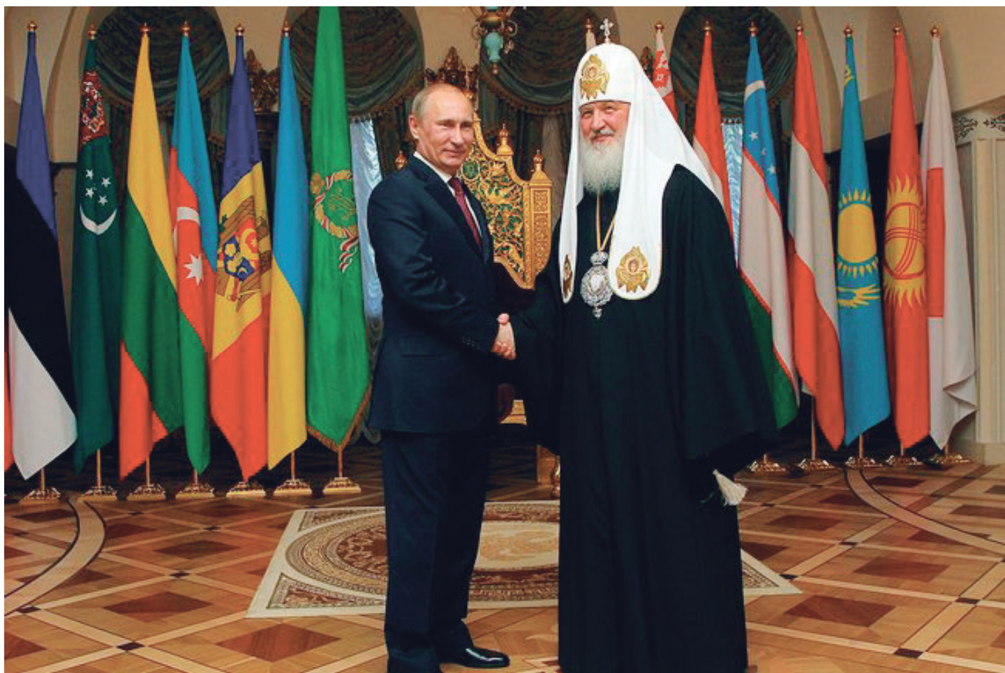
Præsident Vladimir Putin og Patriark Kirill af Moskva og hele Rus (Vladimir Mikhailovitj Gundjajev)

Det sidste er dog lige så meget en tilsnigelse som Putins påstand om, at uafhængigt Ukraine truer Ruslands sikkerhed. Forholdet mellem Moskva-patriarken og præsidenten for den Russiske Føderation er blevet tættere og tættere gennem årene, hvilket har været en integreret del af Putins politik. Grunden til det tætte forhold mellem kirke og stat blev lagt allerede af Aleksej II, der gik aktivt i brechen for Gorbatsjov efter kup-