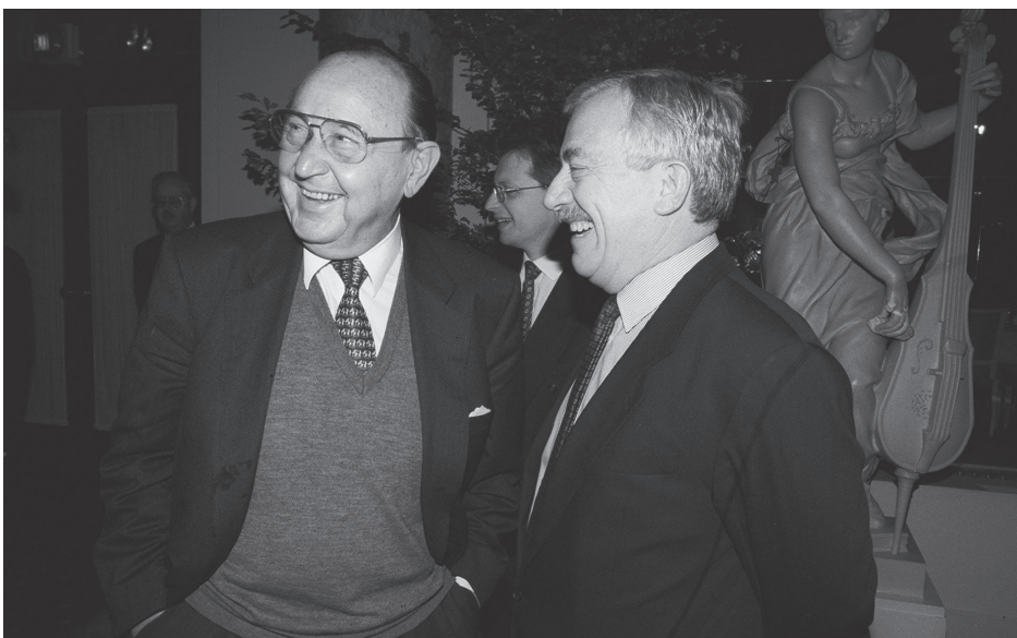
Den fhv. mangeårige tyske udenrigsminister Hans-Dietrich Genscher og Uffe Ellemann-Jensen ved et møde på Hotel Angleterre, København maj 1996.

Selvom Ukraine i 1994 i Budapest-memorandummet fik garanteret sine grænser og suveræniteten (og afleverede sine A-våben til Rusland), så var de ivrige efter at få anerkendt deres europæiske identitet – i første omgang ved at blive medlem af Europarådet før Rusland,