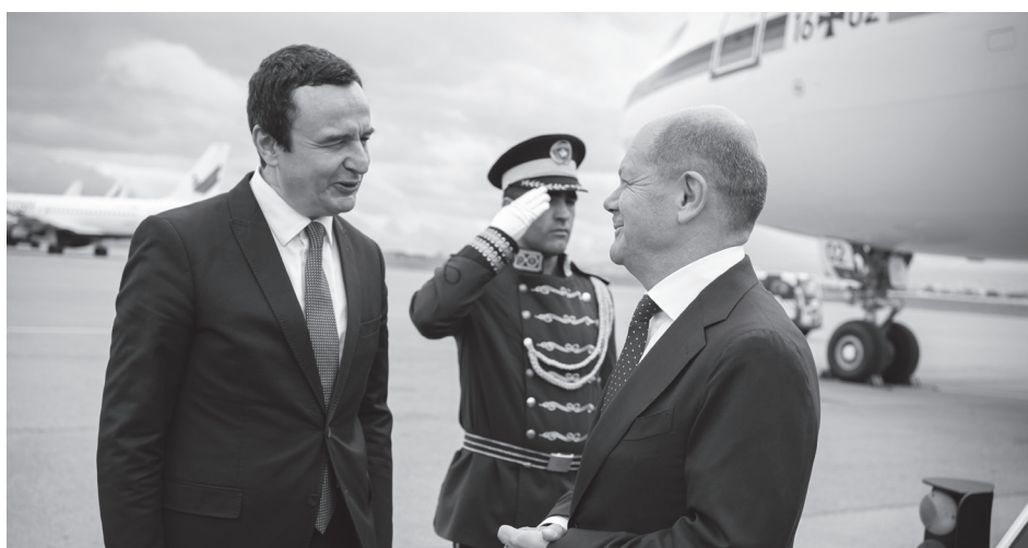
Den 10. juni 2022 modtager Ministerpræsident Albin Kurti Forbunds-kansler Olaf Scholz i Pristina.

Ruslands udenrigsminister Sergej Lavrov har udtalt, at optagelsesstatus i EU ikke udgør nogen risiko for Rusland, kun spørgsmålet om NATO-medlemskab. Set fra Moskva vil forhandling med og optagelse af fattige og korrupte stater kun svække EU økonomisk og kunne skabe mere intern splid.