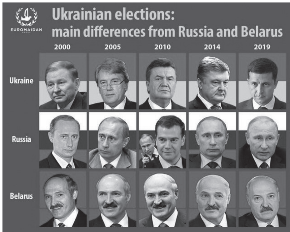
Ukraine har på 20 år haft 5 forskellige præsidenter – modsat Rusland og Belarus.

Men Rusland var også et forhenværende imperium. Ved det første Dumavalg i 1993 var vi en delegation fra Europarådet, der - som valgobservatører - mødte de nye partiers ledere og spurgte dem ud om deres program. Liberal Demokraternes Zjirinovski fortalte, at hans vision var