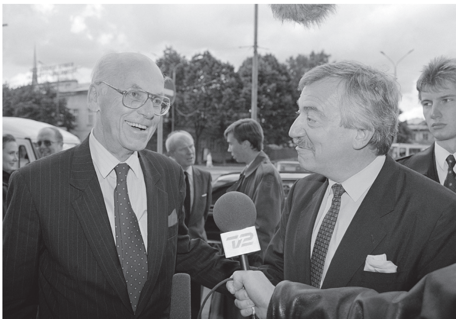
Tallinn september 1991. Uffe Ellemann-Jensen besøger Estlands udenrigsminister Lennart Meri, aktiv CSCE-deltager og senere Estlands præsident.